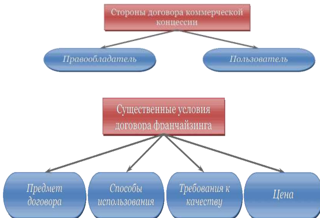
Рисунок 3 – Содержание договора коммерческой концессии

Нумерация листов курсовой работы должна быть сквозной для текста и приложений, начиная с титульного листа. Проставляется нумерация с третьего листа (титульный лист и задание не нумеруются). Номер листа проставляется в справа внизу шрифтом Times New Roman.