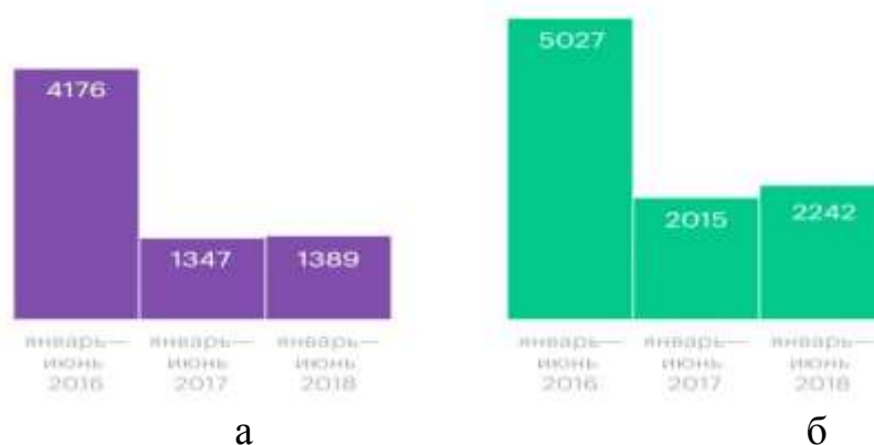
Рисунок 1 – Данные по России по выявленным случаям взятки:

Пример оформления представлен на рисунках 1, 2, 3: